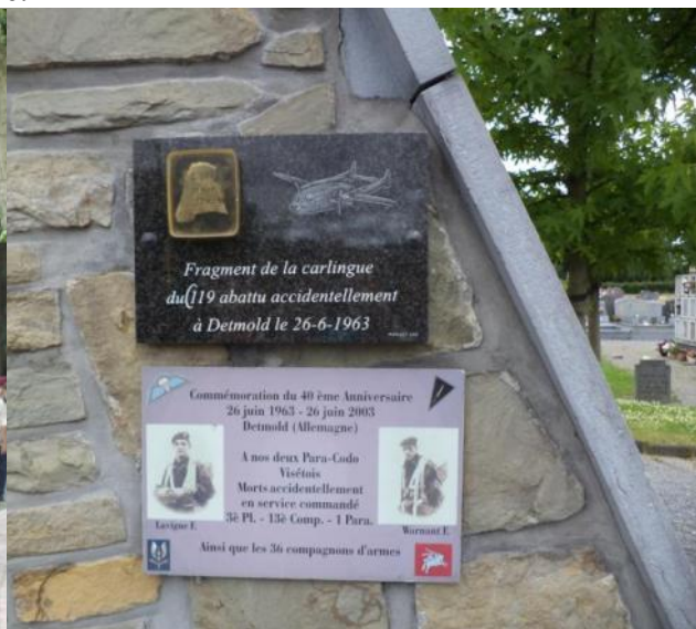
La montée vers le cimetière et la plaque commémorative au cimetière.