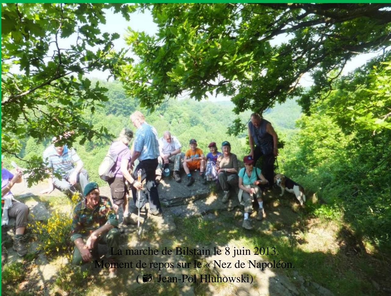
La marche de Bilstain le 8 juin 2013. Moment de repos sur le « Nez de Napoléon ».