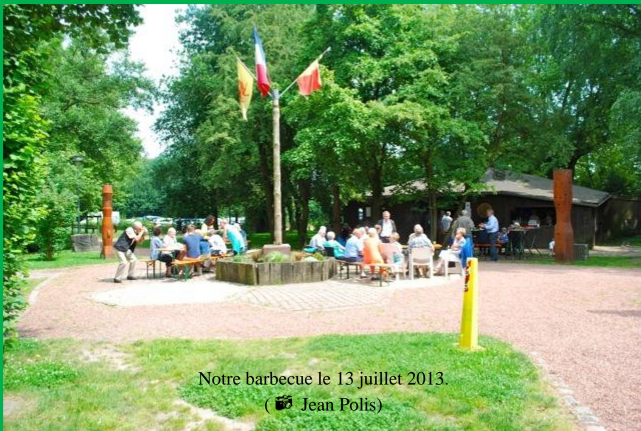
Notre barbecue le 13 juillet 2013. ( 🍷 Jean Polis)