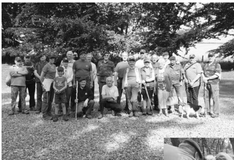
Le groupe des participants au départ.